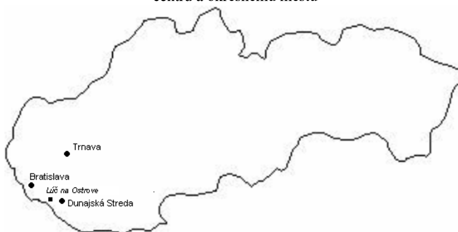
Mapa 1: Poloha obce Lúč na Ostrove na Slovensku vo vzťahu k hlavnému mestu, krajskému centru a okresnému mestu